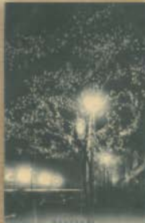
開通式の記念に植えられた日本橋通りの桜。