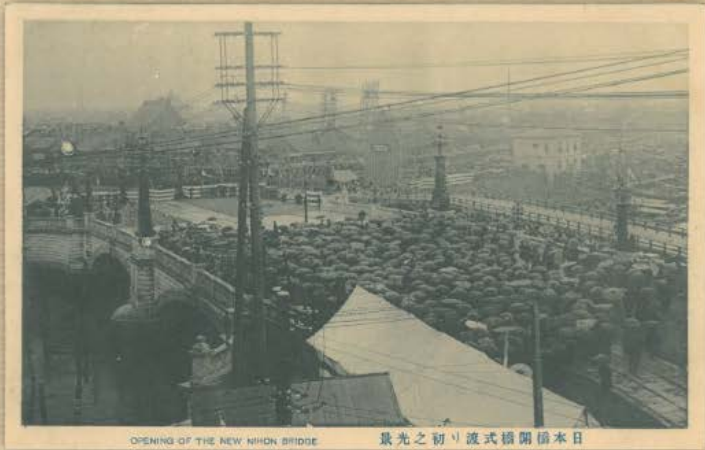
OPENING OF THE NEW NIHON BRIDGE

明治44年(1911年)4月3日、現在の日本橋が架橋されました。小雨降る中、午後1時より開通式が行われ、新たな日本橋のスタートとなりました。