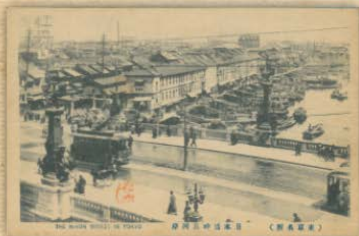
The Nishinagasaki Bridge 新金山新橋 (国鉄式)