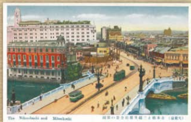
The Nishinagasaki and Minatoguchi 横浜の新金山新橋と三越方面 (国鉄式)

日本橋は様々な時代の表情を絵葉書に残しています。定番の三越方面を臨むアングルをはじめ、いろいろな風景をお楽しみ下さい。