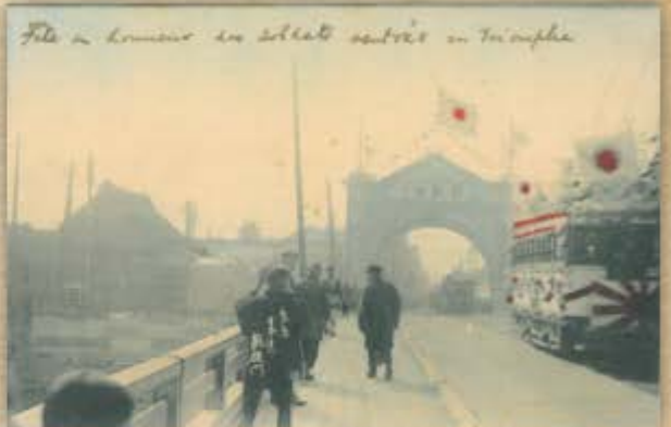
明治37~38年の日露戦争の凱旋門。一代前の日本橋のたもとに建造されました。一週間くらいで作ったハリボテです。