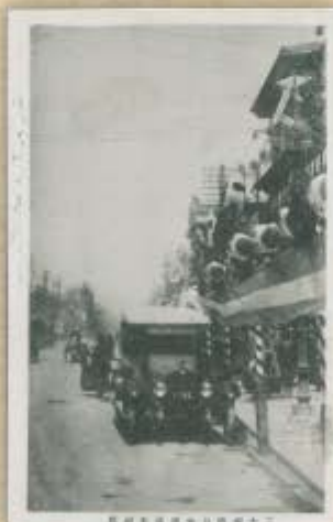
三大祝典の際の日本橋通り。