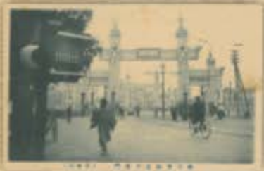
大正四年十一月、大正天皇即位お祝いの奉祝門です。御大典とは、天皇の即位の礼と一連の儀式を合わせて言うことです。