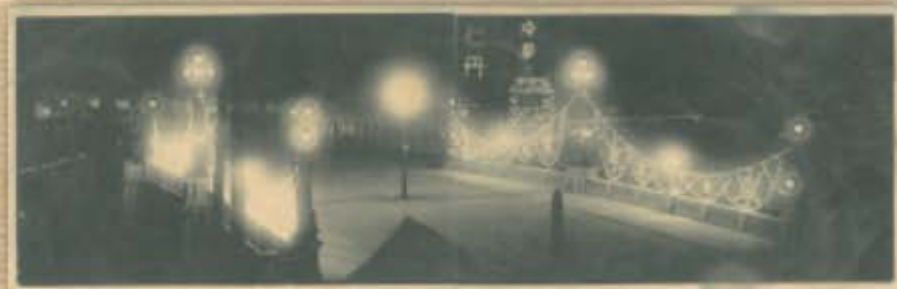
夜は橋も積荷も松も、その他もろもろ全部ライトアップ。