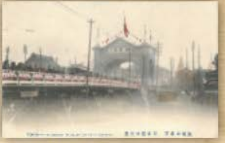
日本橋以外にも京橋、上野、浅草など各地に作られそれぞれデザインが異なりました。