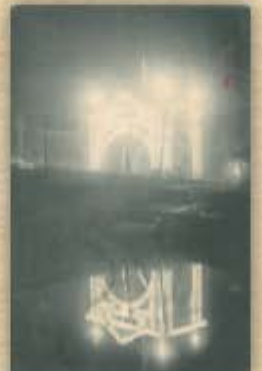
夜はライトアップ。100年以上前のイルミネーション。