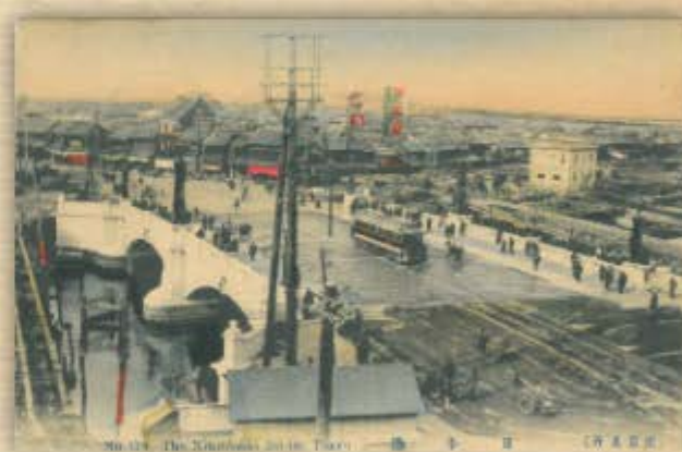
No. 124 The Nishinagasaki Bridge 新金山新橋 (国鉄式)