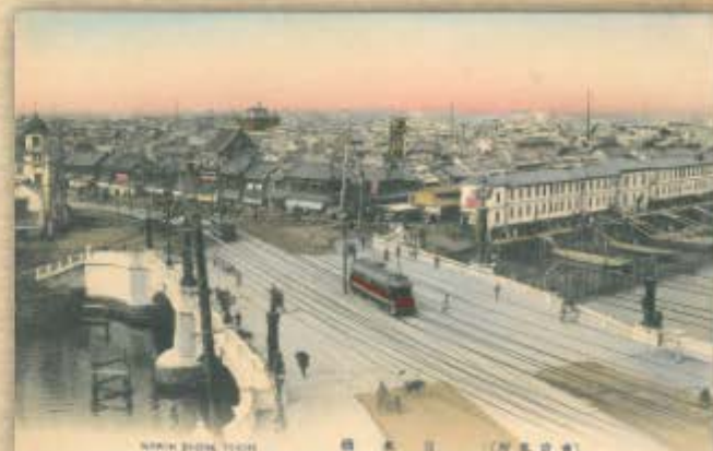
NISHINAGASAKI BRIDGE 新金山新橋 (国鉄式)