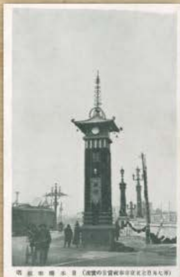
昭和三年十一月、昭和天皇即位記念の奉祝塔。