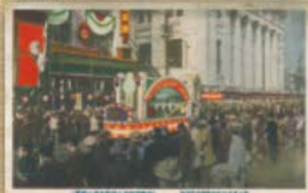
三越の前を通過する奉祝花電車。