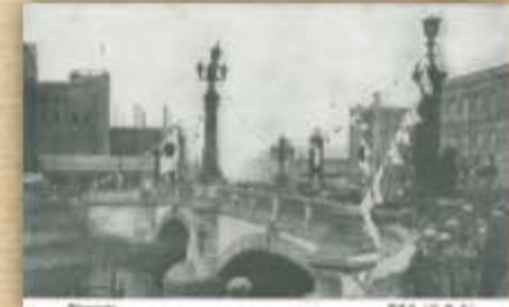
大正十三年六月五日の昭和天皇御成婚お祝い。