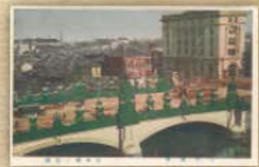
日本橋は杉の葉で裝飾されました。