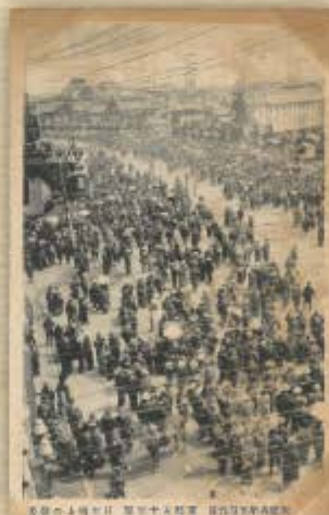
遷都五十年祭の日本橋橋上。