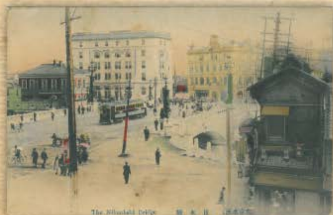
The Nishinagasaki Bridge 新金山新橋 (国鉄式)