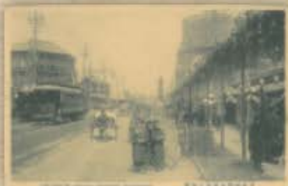
日本橋通り(今の中央通り)中心に街中はお祭り騒ぎ。