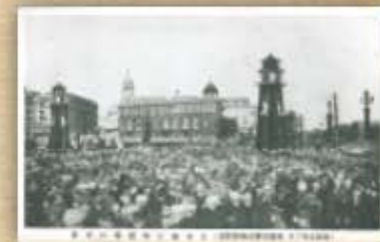
昭和五年三月、関東大震災後の帝都復興が完了した記念の式典。